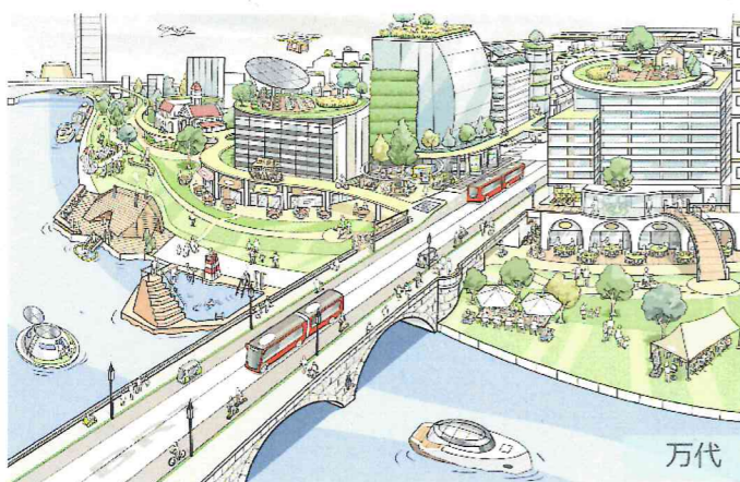
信濃川沿いワクワク空間創出