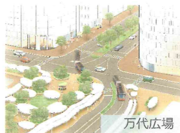
車道の歩行者空間化