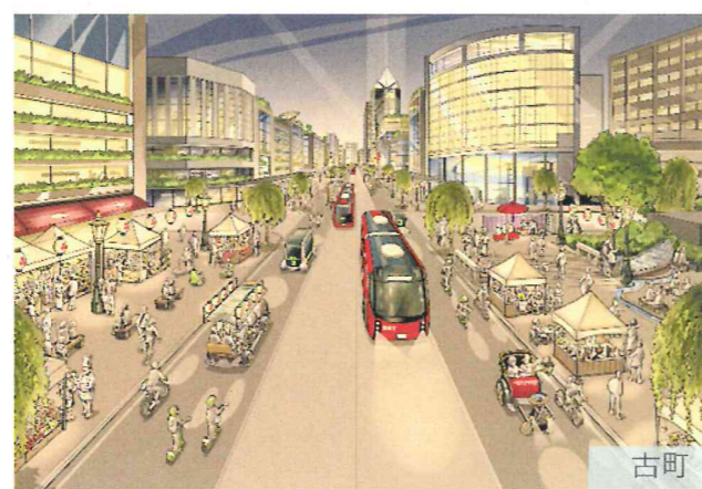
歴史あるみなとまち文化の継承