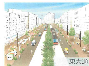
トランジットモール化